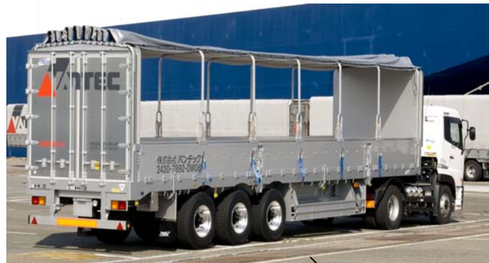
鋼材荷役時 (上開き。天井クレーン荷役可能)